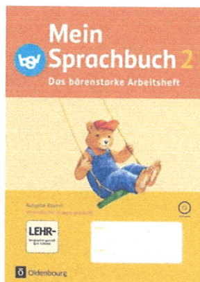
*Mein Sprachbuch 2. Ausgabe Bayern · 2. Jahrgangsstufe, Das bärenstarke Arbeitsheft, vereinfachte Ausgangsschrift ISBN: 978-3-7627-0509-3.

Bitte bestellen Sie beim Buchhandel (Riemann, Thalia, etc.) folgende Arbeitshefte: